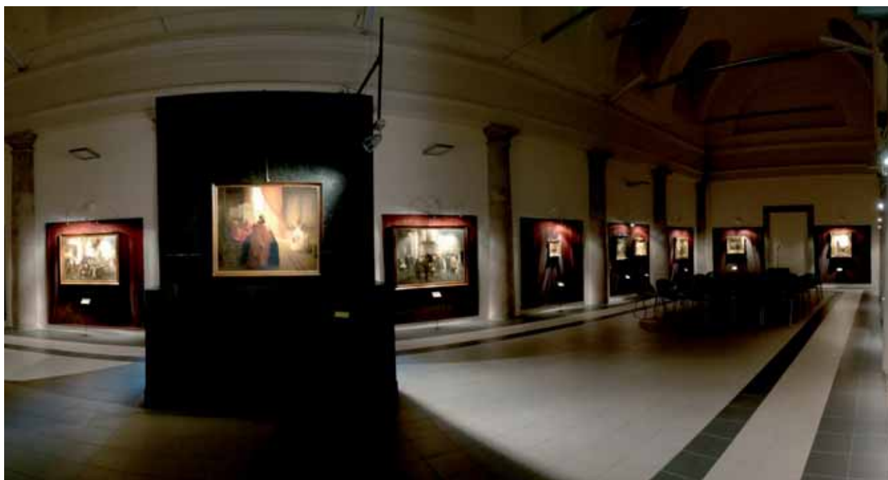
Il salone della Quadreria Bovara-Reina di Malgrate sede della Mostra "L'Italia Unitaria", 27 novembre - 19 dicembre 2010.